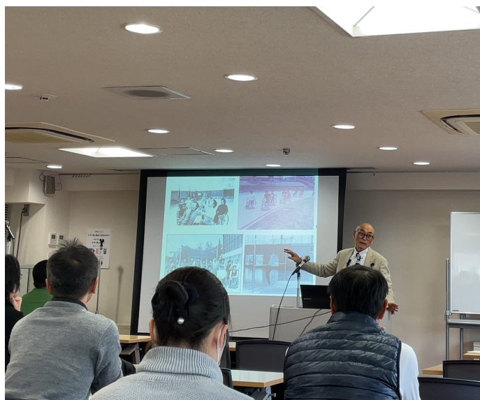
パラスポーツ指導者講習会

文化体育館のジムに通い始めました！ジムからのゆーぶるサウナにハマってます！最高です！！